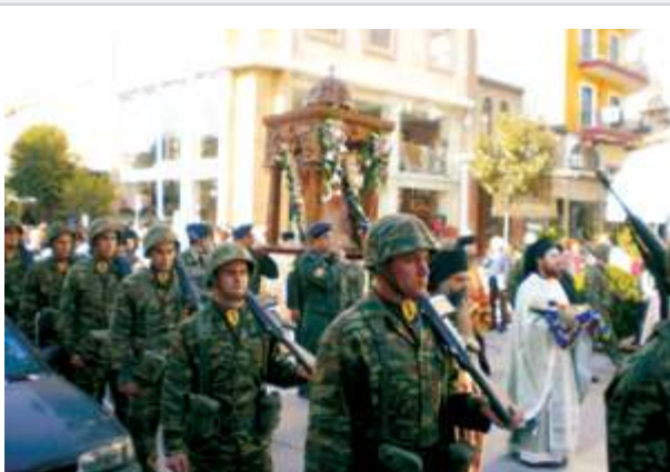
Διάθεση τμήματος αποδόσεως τιμών στα πλαίσια εορτασμού των Ταξιαρχών στην Περιοχή Ευθύνης Α' ΣΣ