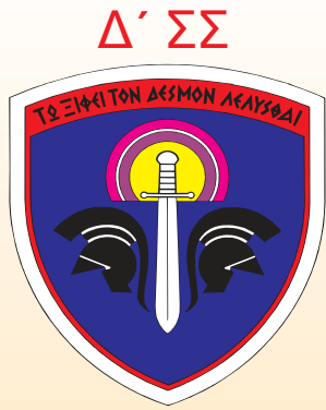
1 ο ΣΠΒ (MLRS)