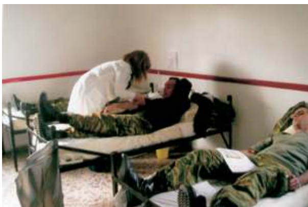
Εθελοντική αιμοδοσία προσωπικού στην Περιοχή Ευθύνης ΑΣΔΕΝ