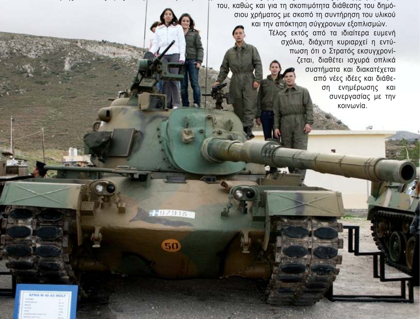
ΑΡΜΑ Μ 48 Α5 ΜΟΛΤ

Τέλος εκτός από τα ιδιαίτερα ευμενή σχόλια, διάχυτη κυριαρχεί η εντύπωση ότι ο Στρατός εκσυγχρονίζεται, διαθέτει ισχυρά οπλικά συστήματα και διακατέχεται από νέες ιδέες και διάθεση ενημέρωσης και συνεργασίας με την κοινωνία.