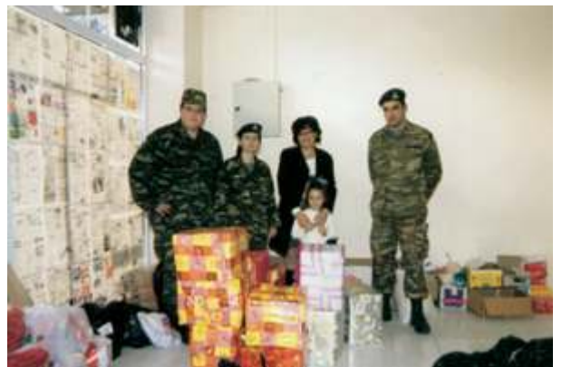
Προσφορά δώρων στην Ιερά Μητρόπολη, στον Ερυθρό Σταυρό και στο γηροκομείο της νήσου Κω