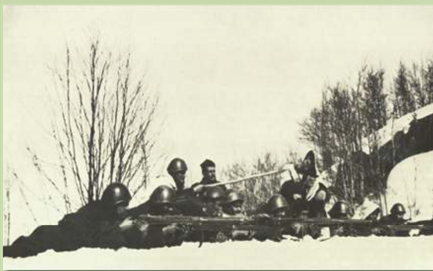
Έλληνες στρατιώτες σε χαράκωμα την Άνοιξη του 1941

Για την πραγματοποίηση της επίθεσης ο ιταλικός στρατός ενισχύθηκε με νέες μονάδες, άρματα μάχης και εφόδια. Ως το τέλος Φεβρουαρίου οι Ιταλοί διέθεταν στο βορειοηπειρωτικό μέτωπο 25 μεραρχίες