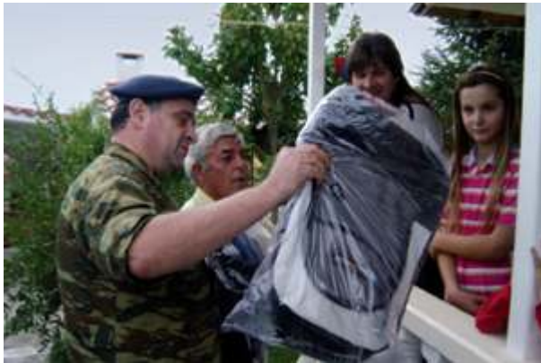
Προσφορά σχολικών ειδών σε μαθητές των πυρόπληκτων περιοχών στην Περιοχή Ευθύνης της IV ΜΠ