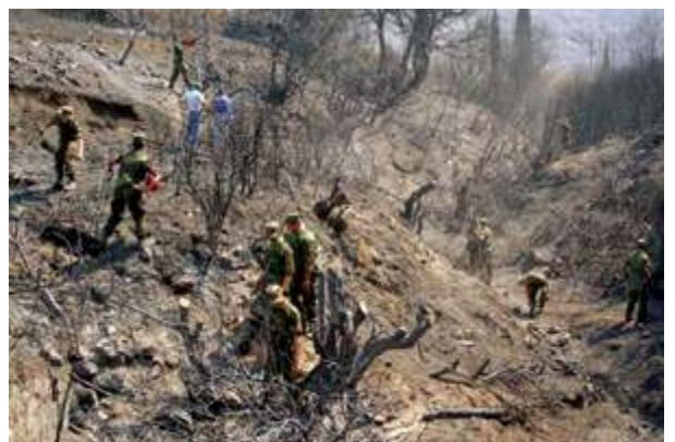
Εργασίες στρατιωτών στα καμμένα των πυρόπληκτων περιοχών στην Περιοχή Ευθύνης της IV ΜΠ