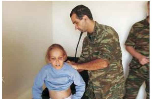
Παροχή πρωτοβάθμιας ιατρικής περιθάλψεως από Κινητή Μονάδα στο χωριό Δροσιά του Νομού Ροδόπης