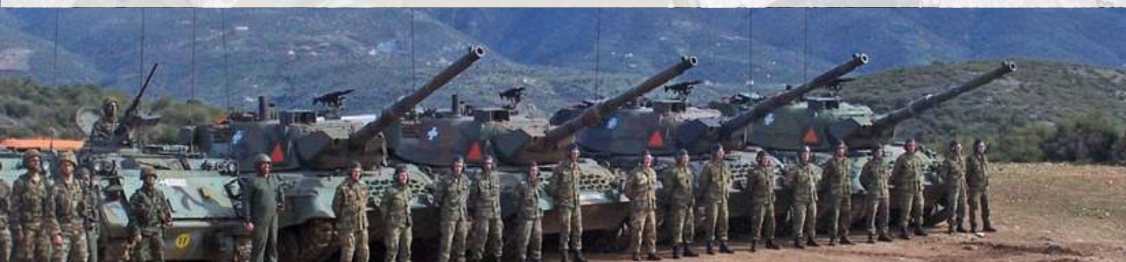
» Τελική Φάση 4ημέρου Τακτικού Αγώνα στο ΠΑ Γλαφυρών