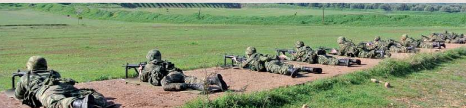
» Τελική Φάση 4ημέρου Τακτικού Αγώνα από το 575 ΤΠ/Ν στο ΠΑ του ΚΕΤΘ