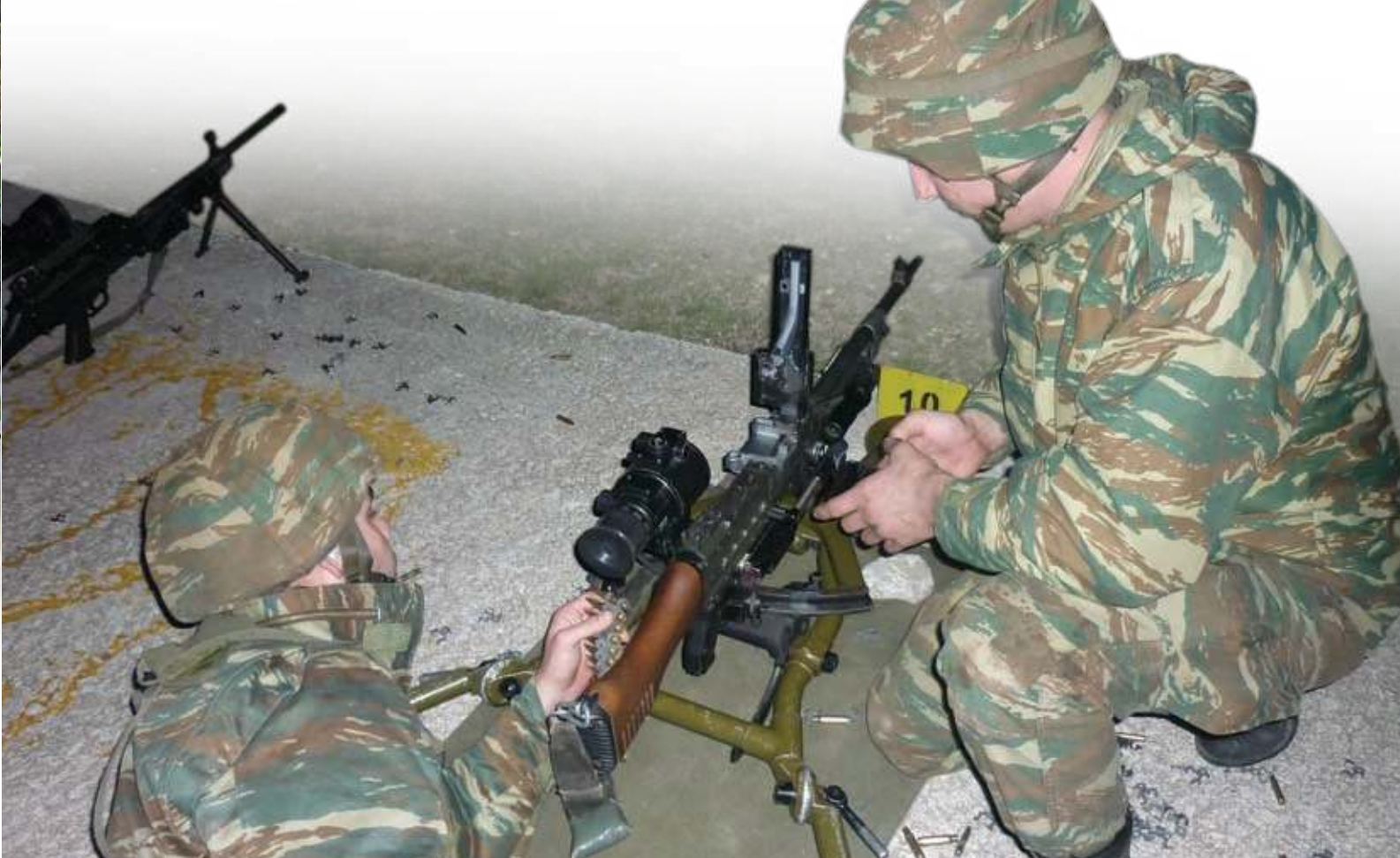
» 4ήμερο Νυχτερινής Εκπαίδευσης από 505 ΤΠ/Ν, 32 ΜΠΠ και 32 ΙΜΑ