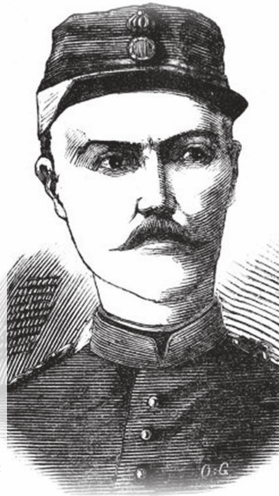
Ο Ταγματάρχης Κωνσταντίνος Λώρης, διοικητής του 5ου Τάγματος Ευζώνων, που έπεσε μαχόμενος στην Κούτρα, στις 10 Μαΐου 1886. Ξυλογραφία (Πηγή: Εθνικόν Ημερολόγιον, Χρονογραφικόν, Φιλολογικόν και Γελλιογραφικόν 2, 1887, 257).

Ο φιλοπόλεμος ενθουσιασμός είχε κυριαρχήσει σε όλη τη χώρα και η κυβέρνηση, μη μπορώντας να αγνοήσει το λαϊκό αίσθημα, είχε παρασυρθεί σε ένθερμες φιλοπολεμικές διακηρύξεις. Ωστόσο, παρά τις απειλές του πρωθυπουργού, ήταν φανερός ο δισταγμός του να φθάσει ως την πολεμική σύρραξη· η στάση του αυτή, μάλιστα, ονομάστηκε χαρακτηριστικά «ειρηνόπολεμος» ή «ένοπλος επαιτεία», αφού με την απειλή του πολέμου προσπαθούσε να εκβιάσει την Τουρκία για την παραχώρηση εδαφικών αποζημιώσεων στην Ελλάδα, λόγω της πραξικοπηματικής προσάρτησης της Ανατολικής Ρωμυλίας.