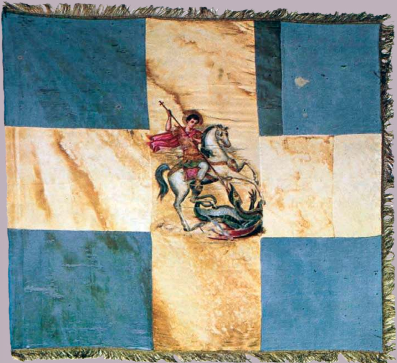
Η πολεμική σημαία του 5ου Τάγματος Ευζώνων. Αθήνα, Εθνικό Ιστορικό Μουσείο (Πηγή: Ιστορία του Ελληνικού Έθνους, Εκδοτική Αθηνών, τόμος ΙΔ΄, 28).

ας στο βουλγαρικό κράτος. Η επιμονή της ελληνικής κυβέρνησης στην απειλή του πολέμου, χωρίς ουσιαστικά να τον επιδιώκει, και η οκτάμηνη παραμονή του Στρατού σε επιφυλακή, με τη μεταφορά αρκετά μεγάλης δύναμης στα ελληνοτουρκικά σύνορα ως τον Απρίλιο του 1886, προκάλεσαν την έντονη αντίδραση των ευρωπαϊκών δυνάμεων, οι οποίες, ζητώντας την αποστράτευση της Ελλάδας, προχώρησαν στον ναυτικό αποκλεισμό των λιμανιών της. Ο Δηλιγιάννης βρέθηκε σε αδιέξοδο, κα-