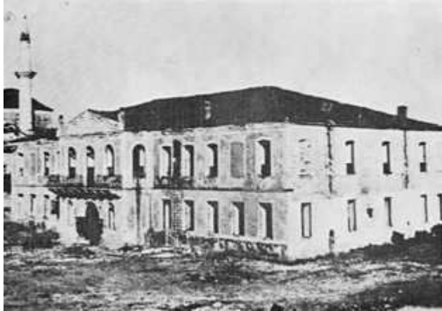
Το 2ο Στρατιωτικό Νοσοκομείο Ιωαννίνων μετά τον βομβαρδισμό του από την Ιταλική αεροπορία στις 20 Απριλίου 1941.

Ιδιαίτερα κατά τους εχθρικούς αεροπορικούς βομβαρδισμούς, ανήμερα του Αγίου Πάσχα (20 Απριλίου 1941), κατά τους οποίους καταστράφηκε ολοσχερώς το 2ο Στρατιωτικό Νοσοκομείο Ιωαννίνων με πενήντα (50) περίπου νεκρούς και τραυματίες, η αξιαγάπητη Αδελφή Νοσοκόμος επέδειξε ασυνήθιστη τόλμη και αυταπάρνηση, προσφέροντας πολύτιμη βοήθεια στα πολυάριθμα θύματα (γιατρούς, νοσηλευτικό και διοικητικό προσωπικό, νοσηλευόμενους τραυματίες και ασθενείς από το μέτωπο) και μάλιστα κατά τη μακάβρια συγκέντρωση των διαμελισθέντων από τις εκρήξεις των βομβών.