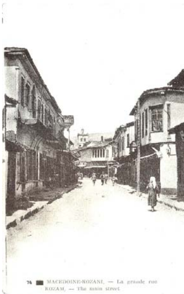
74 ■ MACEDOINE-KOZANI. — La grande rue KOZANI. — The main street

Από τα 1450 μέχρι και το 1612, σταδιακές και μόνιμες εγκαταστάσεις Κονιάρων Τούρκων στις γύρω εύφορες περιοχές, αναγκάζουν όλο και περισσότερους κατοίκους να μετακινηθούν προς την Κόζιανη. Στα 1646-1647, περίπου πενήντα οικογένειες από τα Ακροκεραύνια, με αρχηγό τον Παπαγκίκα, καταφεύγουν στον οικισμό, ενώ άλλες εκατόν είκοσι έρχονται από το χωριό Κτένι, με αρχηγό το μεγαλοκτηνοτρόφο Γιάννη Τράντα, στα 1649, οπότε οι Τουρκαλβανοί κατέστρεψαν το χωριό τους.